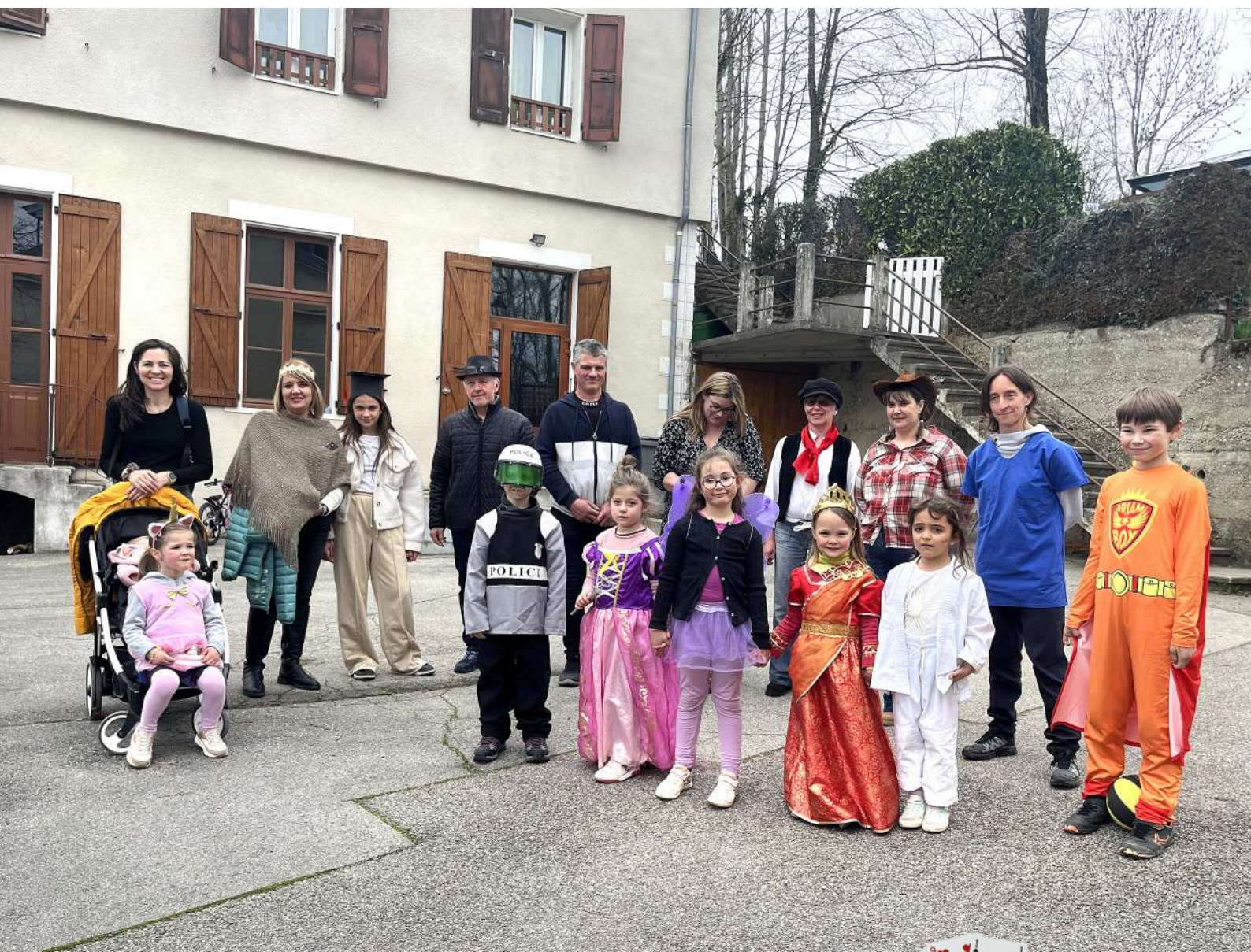
Enfants et adultes se rassemblent autour du maire avant de partir en promenade dans le village.

Cela fait 22 ans que nous fêtons le carnaval à Saint-Michel. Nous nous efforçons de faire de cette fête un moment intergénérationnel, une rencontre entre les anciens et les enfants du village. Balade dans Saint-Michel, jeux musicaux, danses et tartiflette ont rythmé cette journée.