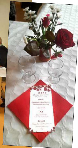
Les aînés sont venus nombreux au repas annuel de la commune.