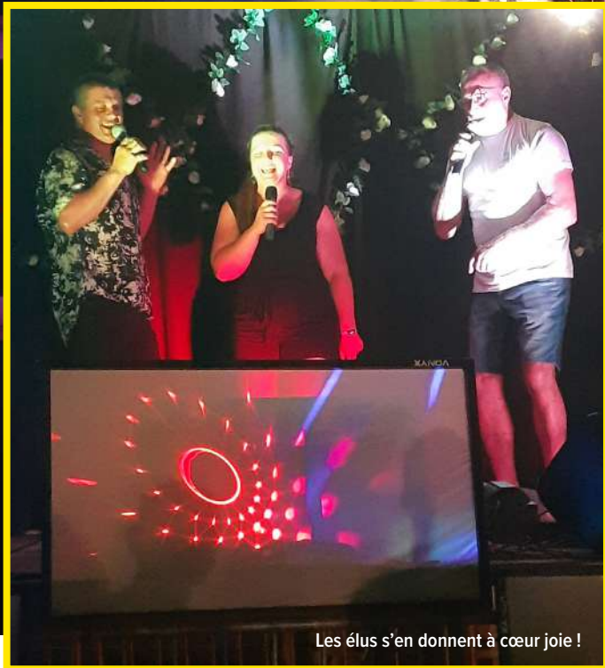
Les élus s'en donnent à cœur joie !

Malgré une météo très incertaine, la commission sociale avait décidé de maintenir la fête de la Musique vendredi 21 juin.