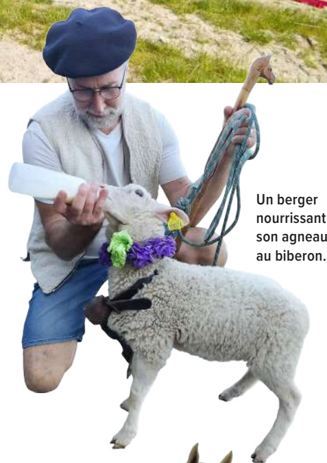
Un berger nourrissant son agneau au biberon.