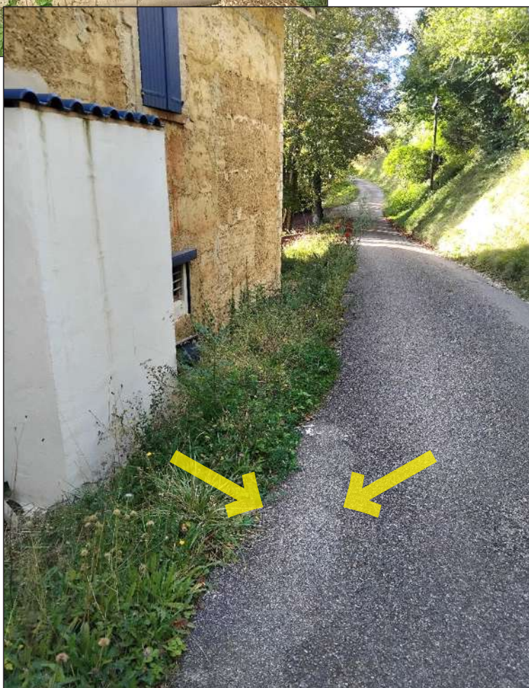
Affaissement chemin des Arêtes.

L'étude a été réalisée le mercredi 10 juillet. Le retour ayant été fait, le chiffrage du montant des travaux est alors lancé.