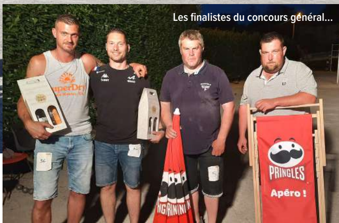
Les finalistes du concours général...