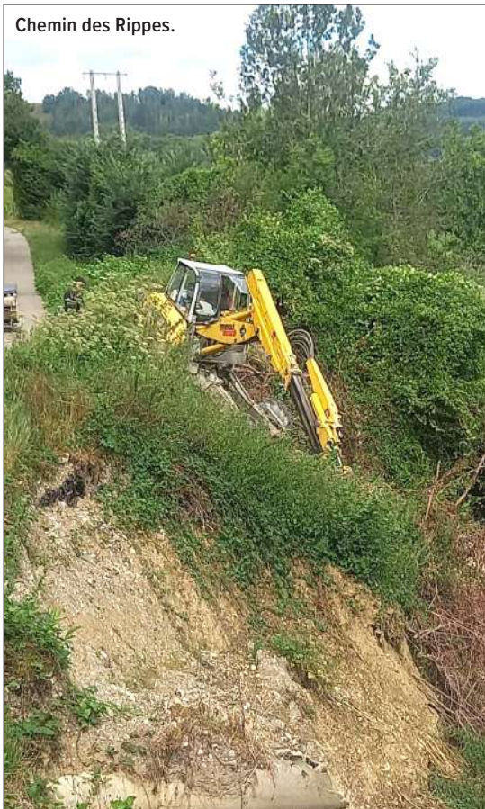
Chemin des Rippes.

■ La rénovation du système d'assainissement du bâtiment industriel , suite à d'importants soucis de fonctionnement, et le remplacement des menuiseries.