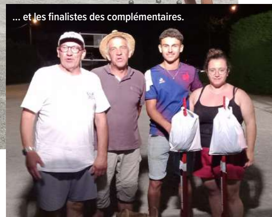
... et les finalistes des complémentaires.

Tous les participants, bien équipés de casquettes, ont pu profiter de la buvette et de la restauration tenues par l'équipe municipale. La table de marque a enregistré 40 doublettes et 14 équipes complémentaires . Nos très jeunes joueurs étaient à nouveau présents cette année