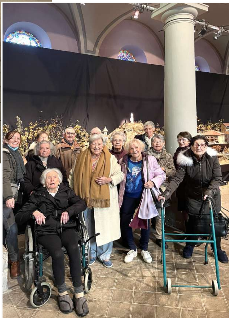
Moment de découverte et d'émerveillement pour nos anciens de La Caravelle (à gauche) et de La Ricandelle (à droite), venus apprécier le village miniature et la crèche de la Nativité.