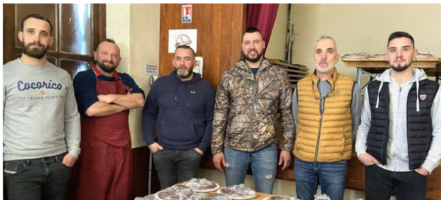
Les organisateurs de cette manifestation.

Nous avons vendu presque la totalité de nos produits sur réservation : boudins, terrines de chevreuil, fricassées.