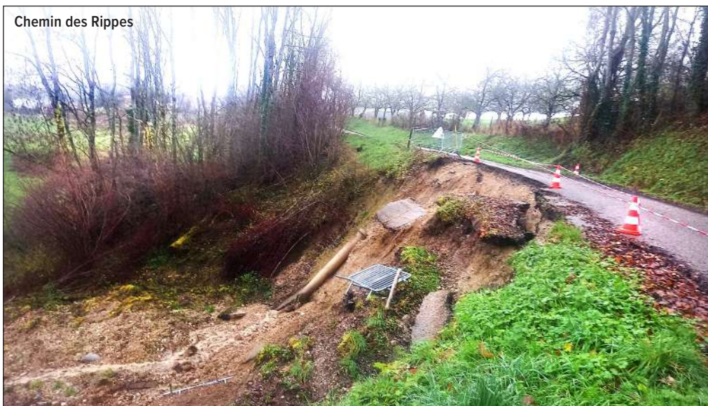
Chemin des Rippes