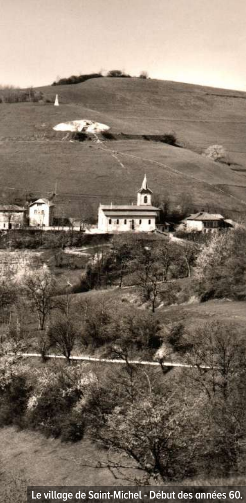
Le village de Saint-Michel - Début des années 60.

distribution à plusieurs maisons. Il faudrait donc installer une nouvelle conduite avec l'entreprise Pistono.