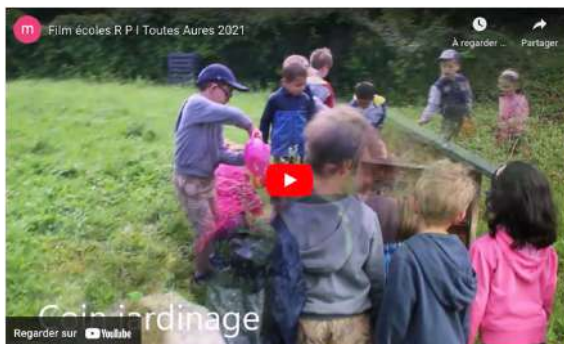
Vidéo de présentation du RPI : https://youtu.be/ACylyBA8_nA