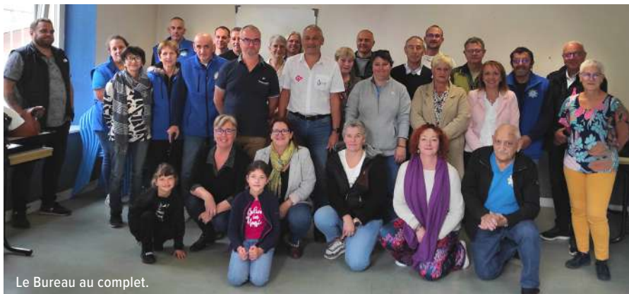
Le Bureau au complet.