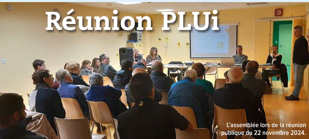
L'assemblée lors de la réunion publique du 22 novembre 2024.

Le travail a commencé par un état des lieux avec les élus et les services de bièvre Isère puis s'est engagé un mois de concertation du 15 novembre au 15 décembre.